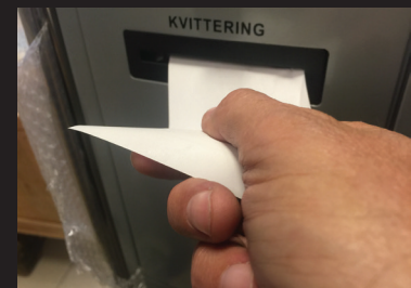
Kvitteringer skrives ut til kunden