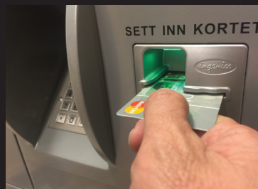
Aksepterer bank- og kredittkort