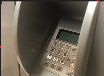
BSK og PNC-godkjent innsynsbeskyttelse